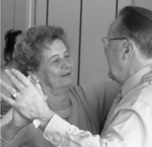
Zeit und Lebenslust: