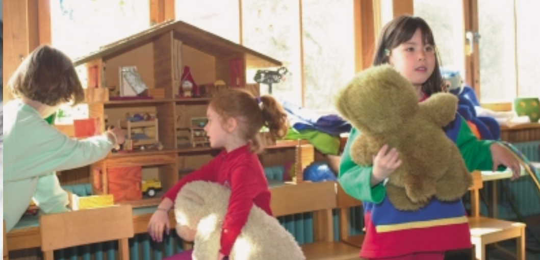
Senioren-Tanzparty im «Sixty One», Spielgruppe im Kindergarten Honeggerstrasse in Wollishofen