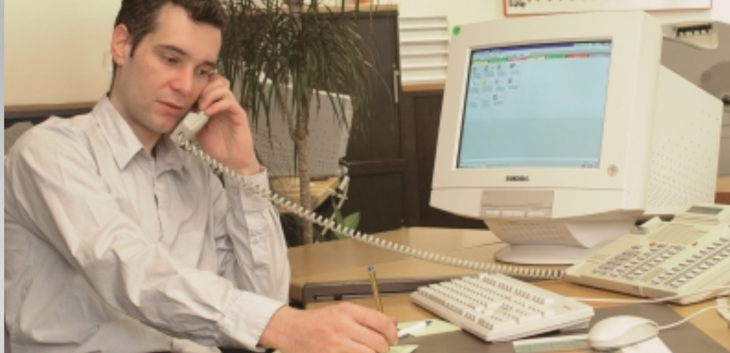
Freizeit und Arbeit: Joggen in Zürich-Albisrieden und Konzentration am Arbeitsplatz