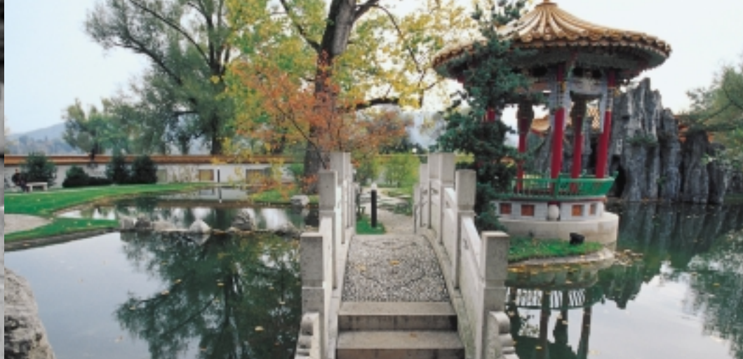
Natur, Körper und Geist verbinden: