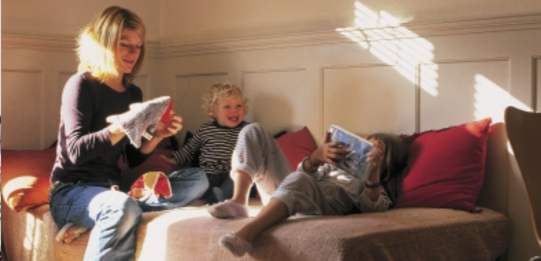
Geborgenheit und Lebensfreude: Familienwohnung an der Neugasse im Kreis 5