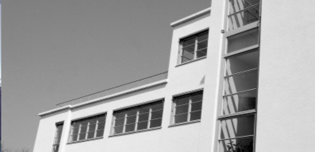
Neuer Wohnraum für Individualisten: