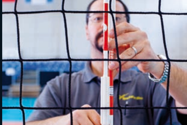
Bild: Gherardo Rainone, stellvertretender Anlageleiter der Sporthalle im Birch, beim Aufbau der Volleyball-Anlage für den Champions-League-Achtelfinal der Damen

Mit einem Deckungsgrad von komfortablen 130% sind die Pensionsansprüche der rund 27'600 städtischen Angestellten solide abgestützt.